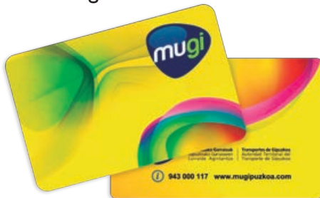
Mugi Txartel Anonimoa