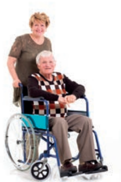
Soziala, Desgaituak eta 65 urtetik gorakoak