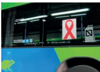
IHESaren aurkako Borroka Nazioarteko Eguna, abenduaren 1a