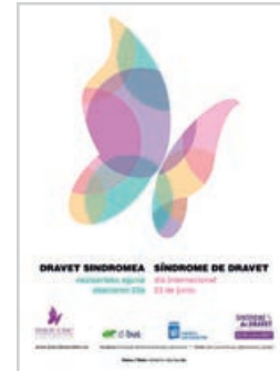
Dravet Sindromearen inguruko Kontzientzia Eguna, ekainaren 23a