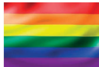
Transexualen, bisexualen, lesbianen, gayen eta queerren askapen afektibo-sexualaren nazioarteko eguna, ekainaren 28an

2017an, Dbus-ek zenbait elkarterekin eta gizarte talderekin lankidetzan jarraitu du.