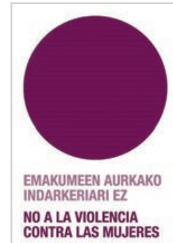
Emakumeenganako Indarkeriaren aurkako Nazioarteko Eguna, azaroaren 25a