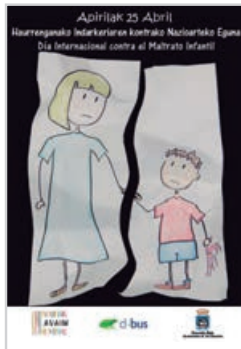
Haurren aurkako tratuen nazioarteko eguna, apirilaren 25ean