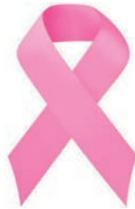
Bularreko Minbiziaren aurkako Munduko Eguna, urriaren 19a