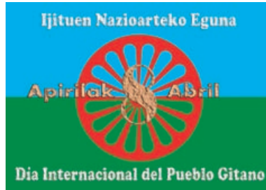
Ijito Herriaren Nazioarteko Eguna, apirilaren 8a