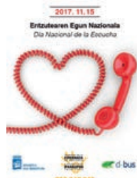
Entzutearen Nazioarteko Eguna, azaroaren 15ean