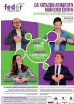
Gaixotasun Arraroen Munduko Eguna, otsailaren 28a

2017an gauzatutako lankidetzak guztien erakusgarri txiki bat da hau.